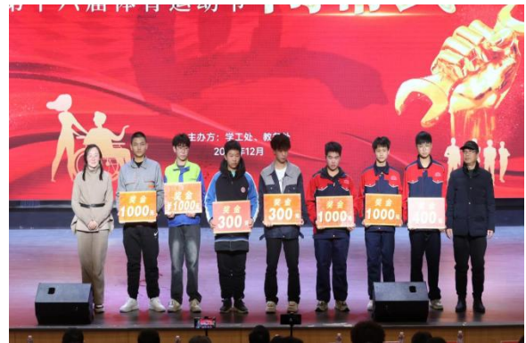
△出席领导为各类国、省、市大赛获奖选手颁发奖金